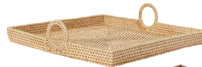
← Plateau en rotin, 15 ½ po x 15 ½ po, 59,99 $, H&M Home

Pratique partout dans la maison, le plateau est un objet qu'on aime aussi avoir dans la chambre. On y dépose notre café-croissant du matin ou notre livre, en soirée, pour vivre de beaux petits moments de détente au lit.