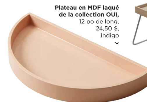
Plateau en MDF laqué de la collection OUI, 12 po de long, 24,50 $, Indigo