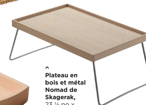
^ Plateau en bois et métal Nomad de Skagerak, 23 ½ po x 13 ½ po, 376 $, grshop.com