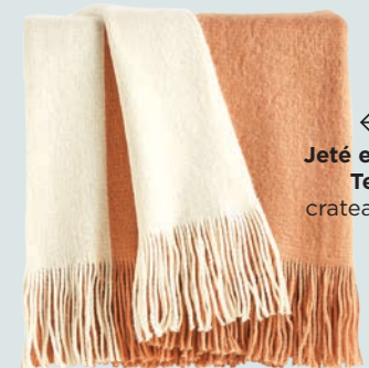
← Jeté en acrylique Tepi, 79,95 $, crateandbarrel.ca