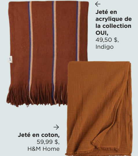
← Jeté en acrylique de la collection OUI, 49,50 $, Indigo